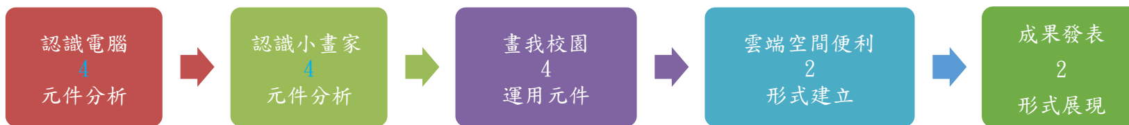
本表為第一單元教學流設計/(本學期共五個單元)