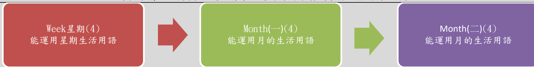
課程架構脈絡圖(單元請依據學生應習得的素養或學習目標進行區分)