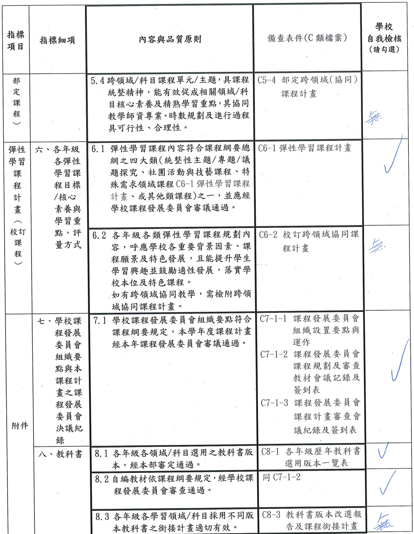
A03 學校課程計畫自我檢核表