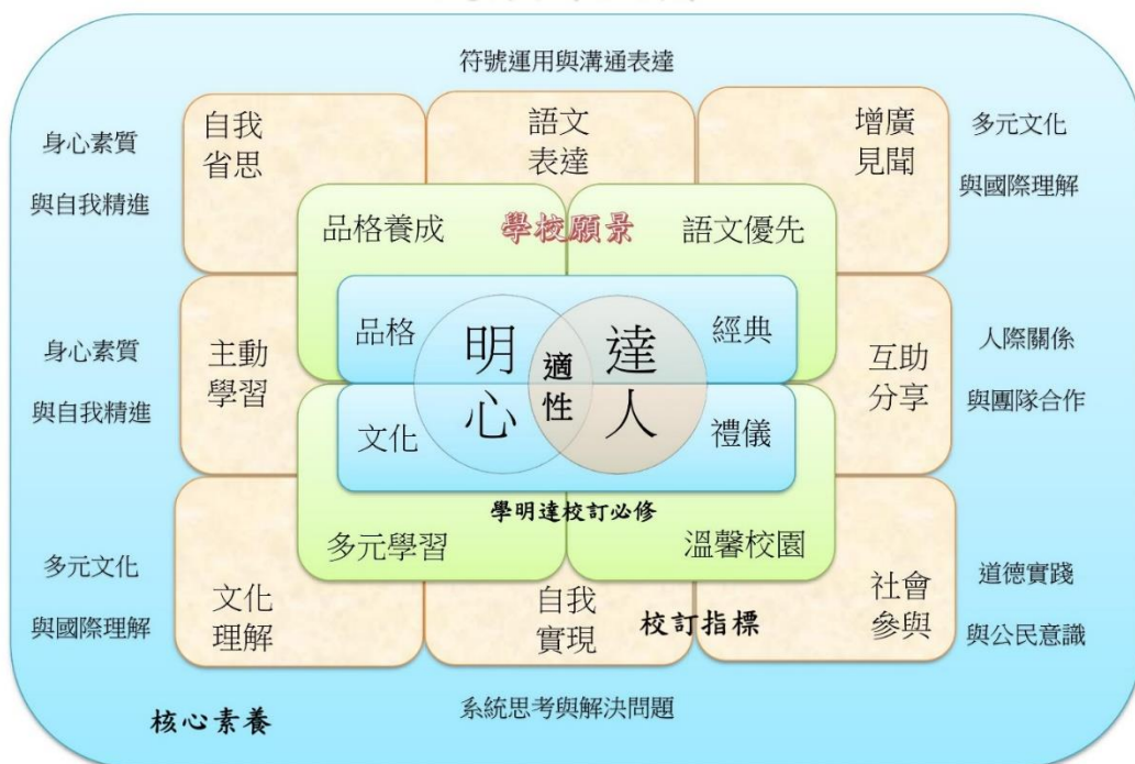
明達高中學生圖像