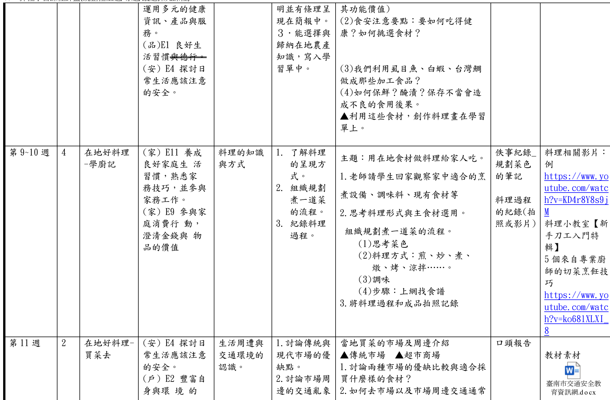
C6-1 彈性學習課程計畫(統整性主題/專題/議題探究課程)