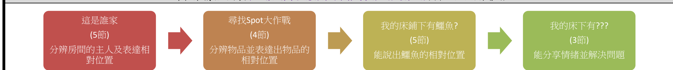
課程架構脈絡圖(單元請依據學生應習得的素養或學習目標進行區分)(單元脈絡自行增刪)