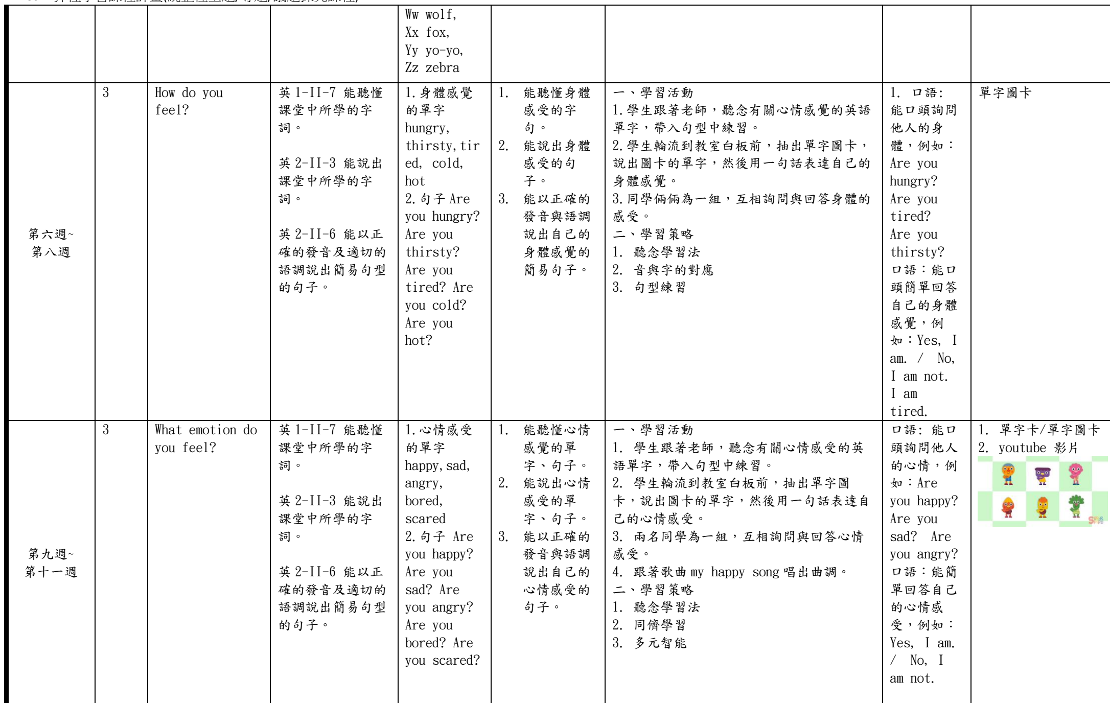
C6-1 彈性學習課程計畫(統整性主題/專題/議題探究課程)