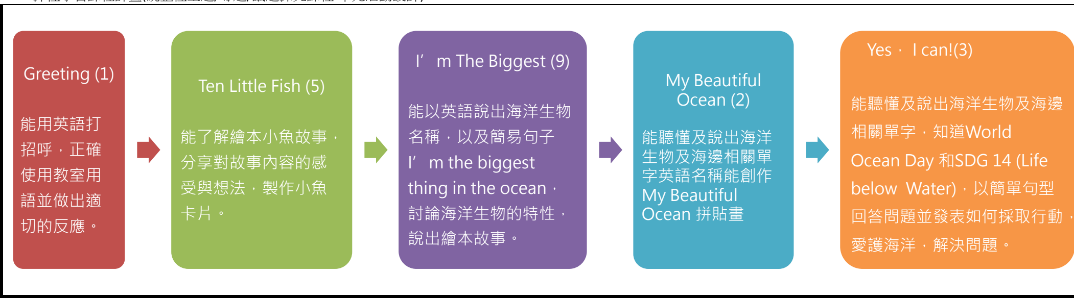
本表為第一單元教學流設計(本學期共五個單元)