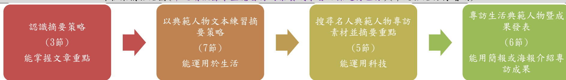
課程架構脈絡圖(單元請依據學生應習得的素養或學習目標進行區分)(單元脈絡自行增刪)