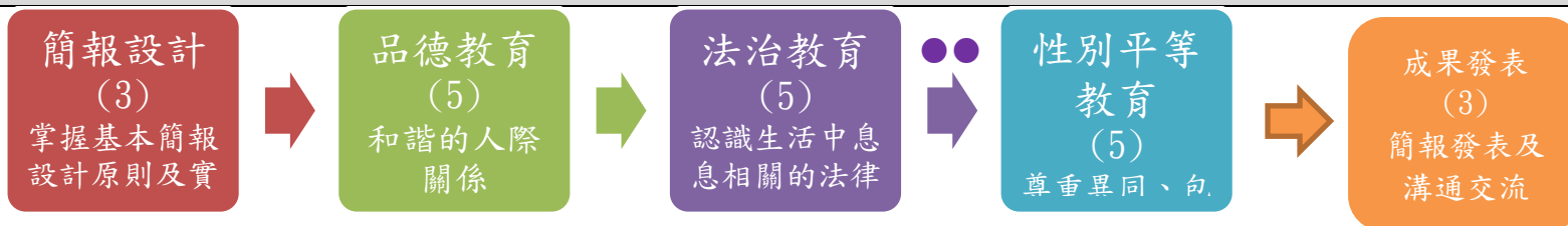
課程架構脈絡(單元請依據學生應習得的素養或學習目標進行區分)(單元脈絡自行增刪)