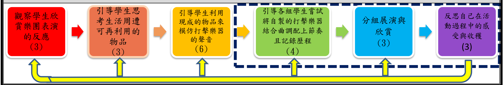
PBL 6P 學習架構與模式脈絡圖(各單元問題脈絡)