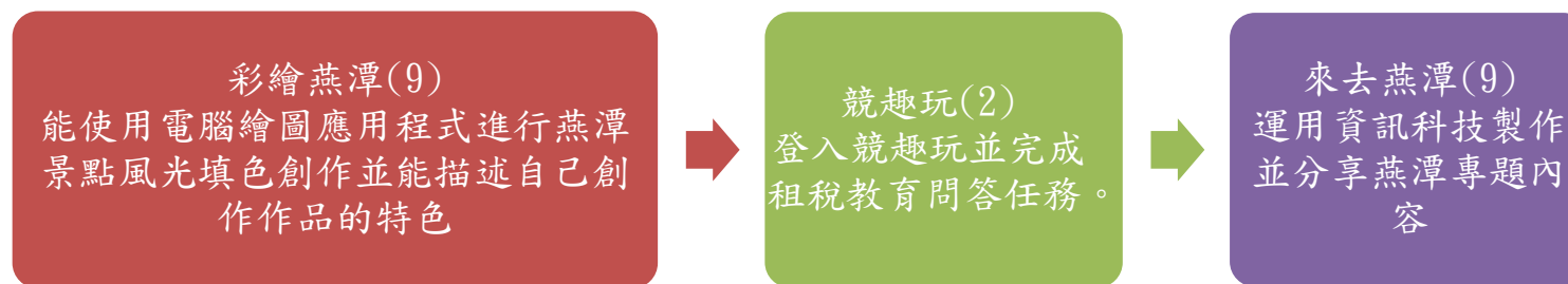
課程架構脈絡圖(單元請依據學生應習得的素養或學習目標進行區分)(單元脈絡自行增刪)