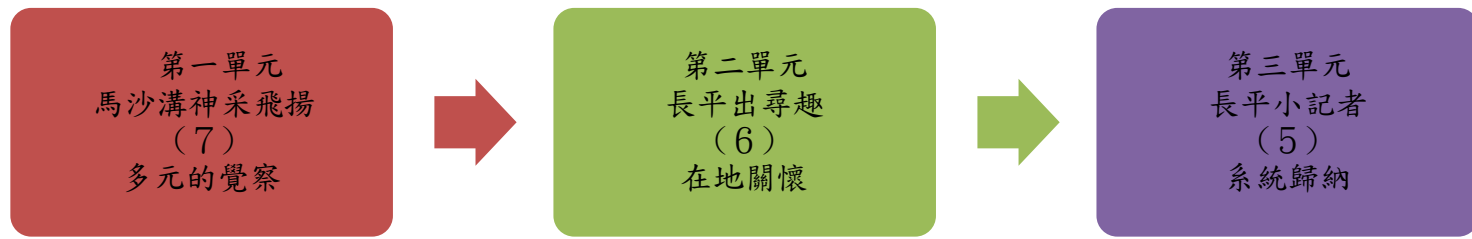
課程架構脈絡圖(單元請依據學生應習得的素養或學習目標進行區分)(單元脈絡自行增刪)