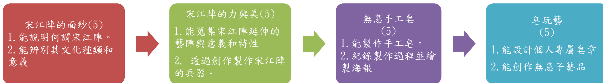
課程架構脈絡圖(單元請依據學生應習得的素養或學習目標進行區分)(單元脈絡自行增刪)