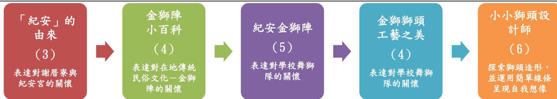
課程架構脈絡圖(單元請依據學生應習得的素養或學習目標進行區分)(單元脈絡自行增刪)