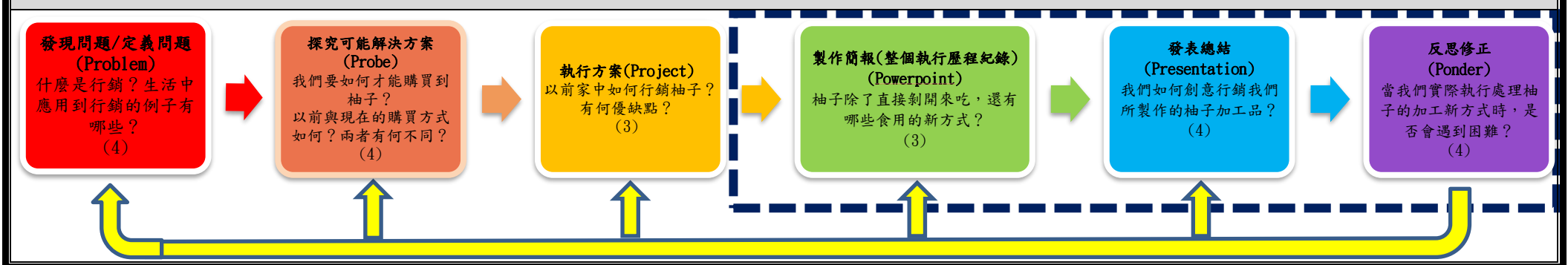
PBL 6P 學習架構與模式脈絡圖(各單元問題脈絡)