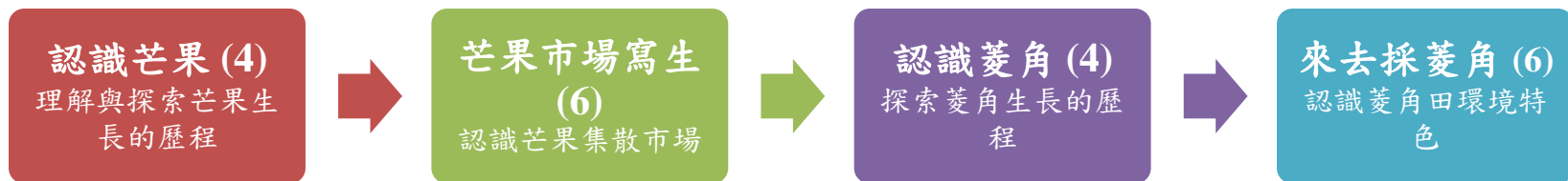
課程架構脈絡圖(單元請依據學生應習得的素養或學習目標進行區分)(單元脈絡自行增刪)