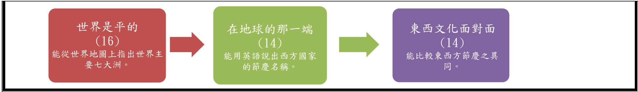
本表為第 1 單元教學流設計/(本學期(年)共 3 個單元)