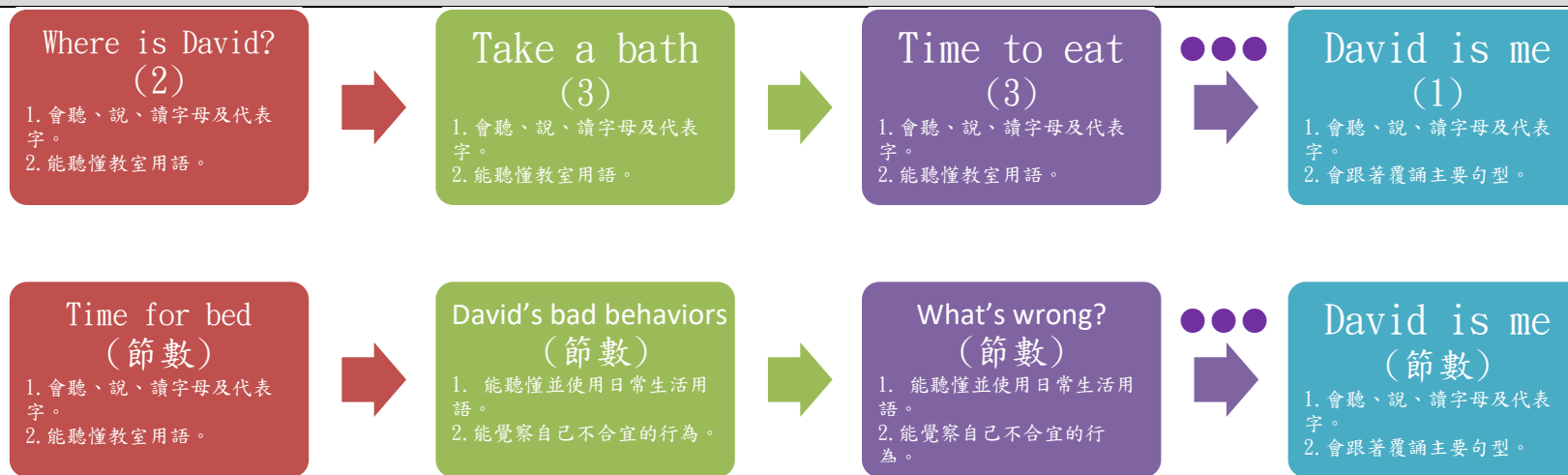
課程架構脈絡(單元請依據學生應習得的素養或學習目標進行區分)(單元脈絡自行增刪)