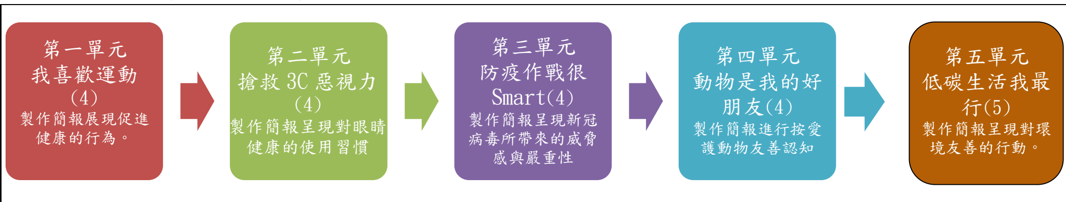
本表為第 1 單元教學流程設計/(本學期共 5 個單元)