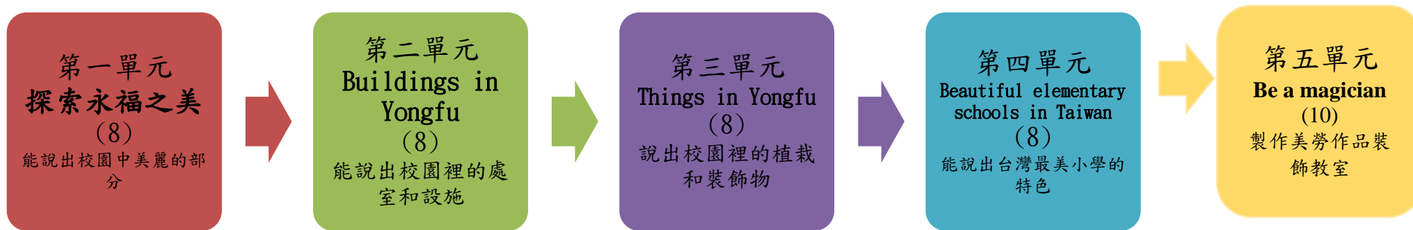
本表為第 1 單元教學流程設計/(本學期共 5 個單元)