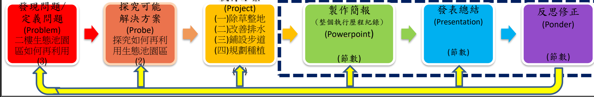
PBL 6P 學習架構與模式脈絡圖(各單元問題脈絡)