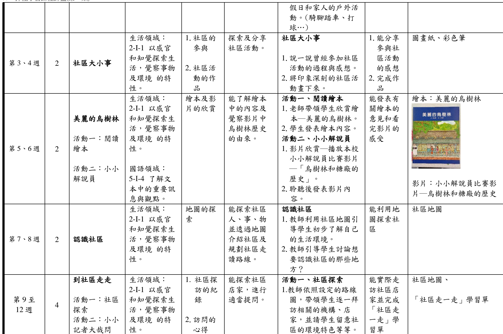
C6-1 彈性學習課程計畫(第一類)