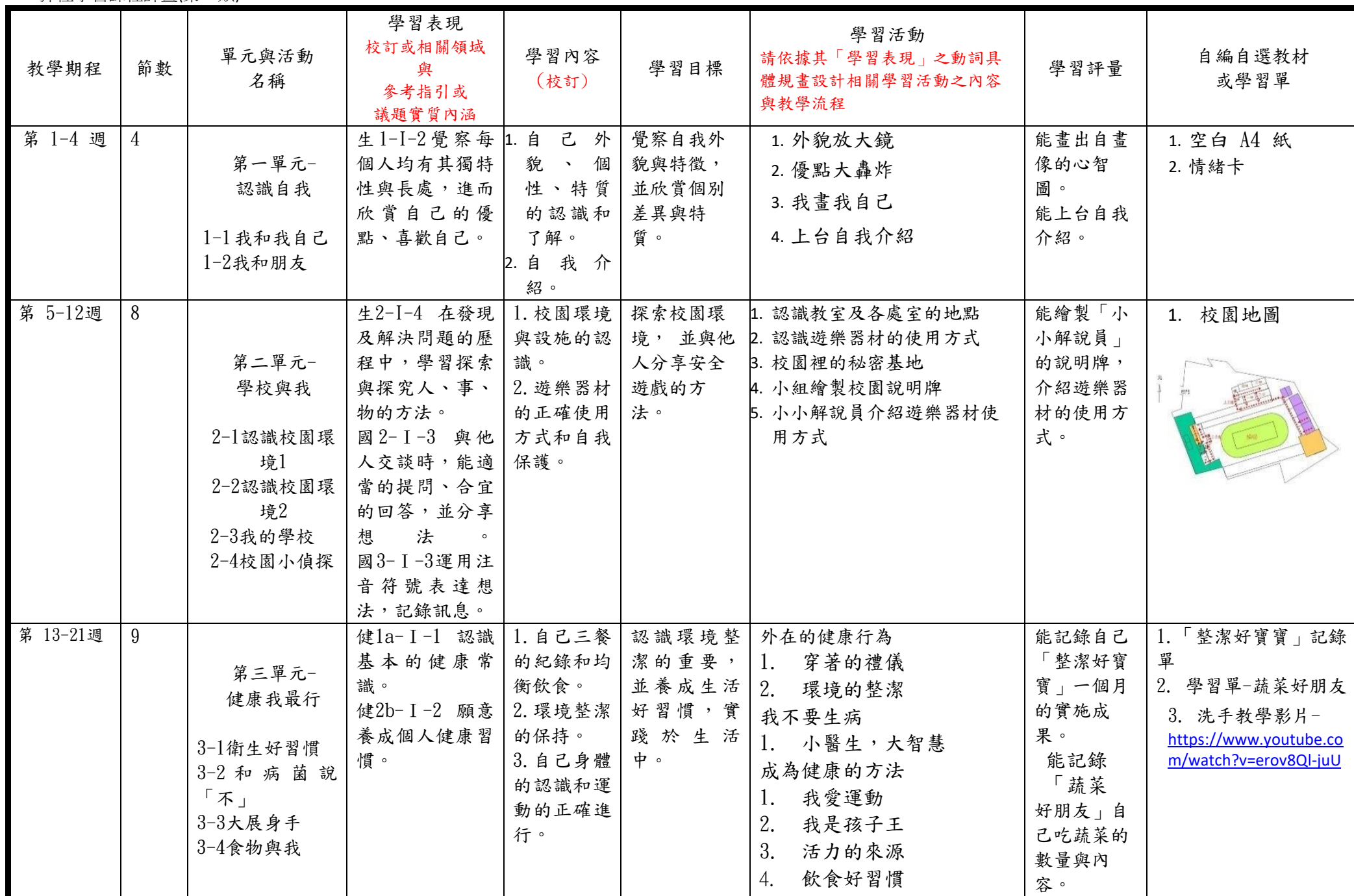
C6-1 彈性學習課程計畫(第一類)