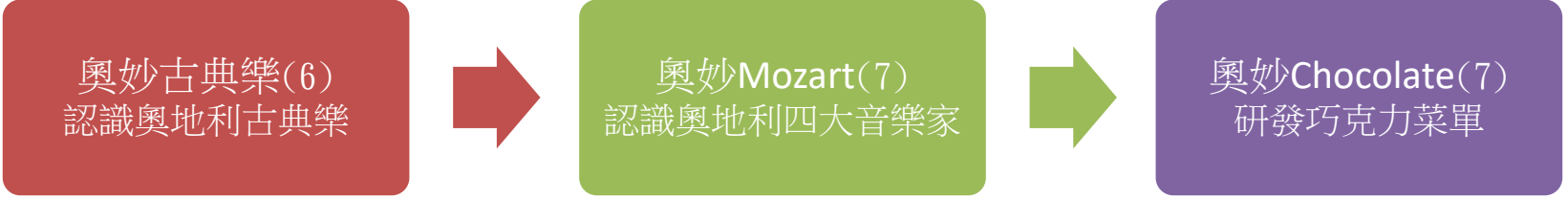
本表為第 1 單元教學流設計/(本學期共 3 個單元)