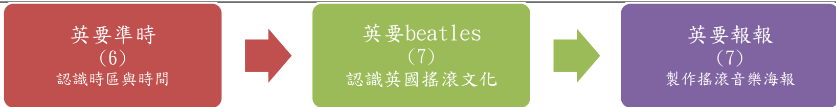
本表為第 1 單元教學流設計/(本學期共 3 個單元)