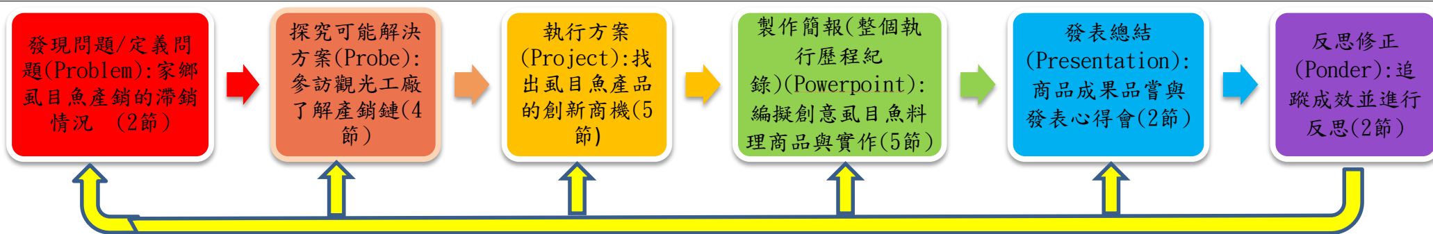
PBL 6P 學習架構與模式脈絡圖(各單元問題脈絡)