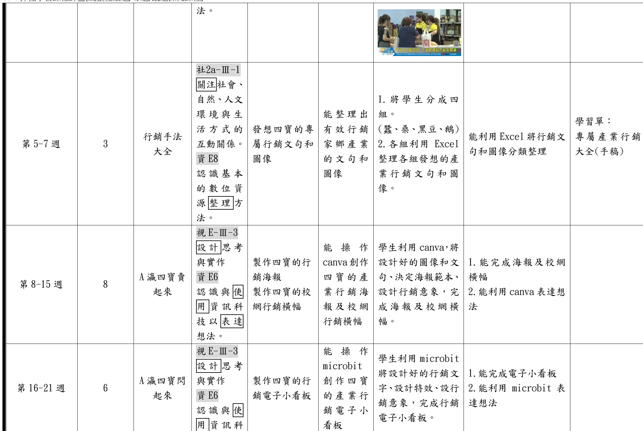
C6-1 彈性學習課程計畫(統整性主題/專題/議題探究課程)