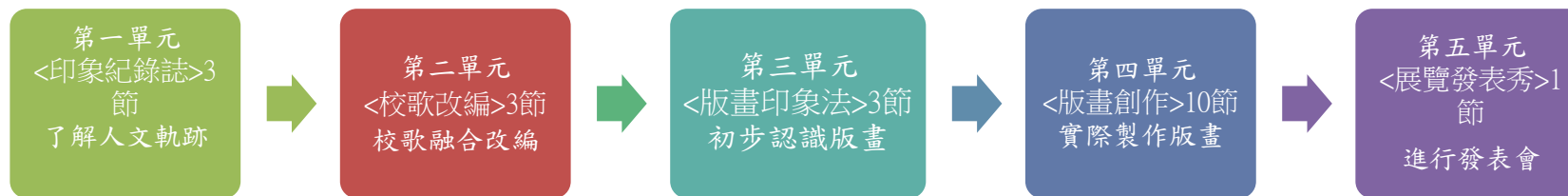
本表為第 1 單元教學流程設計/(本學期共 5 個單元)