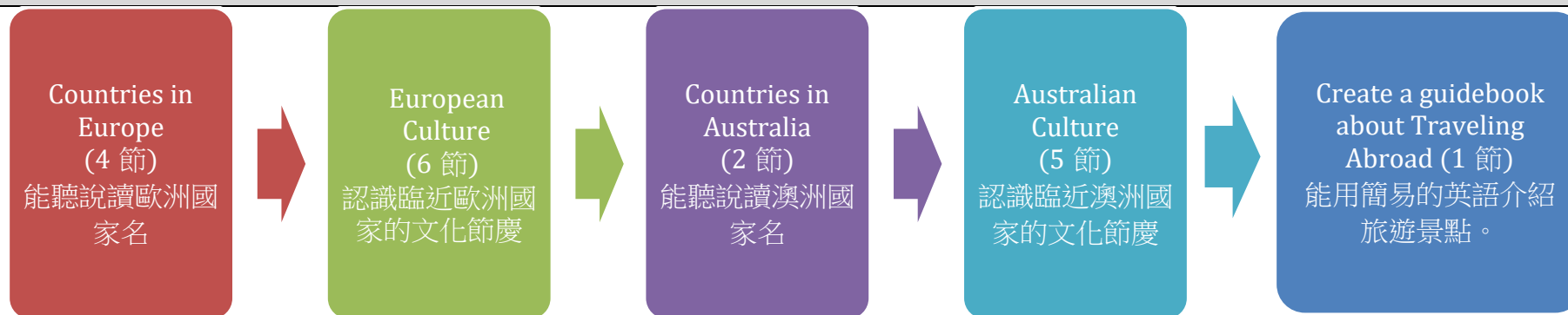
課程架構脈絡圖(單元請依據學生應習得的素養或學習目標進行區分)(單元脈絡自行增刪)