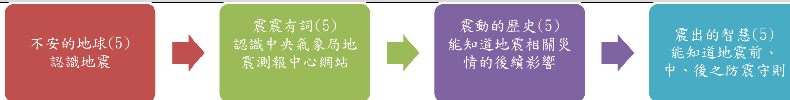
課程架構脈絡(單元請依據學生應習得的素養或學習目標進行區分)(單元脈絡自行增刪)