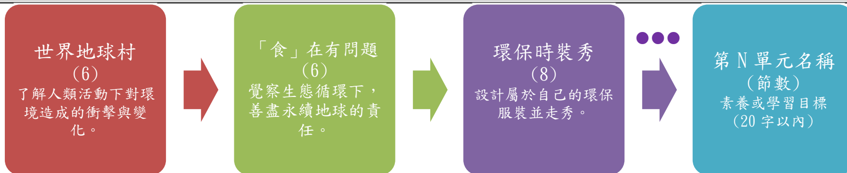
課程架構脈絡(單元請依據學生應習得的素養或學習目標進行區分)(單元脈絡自行增刪)