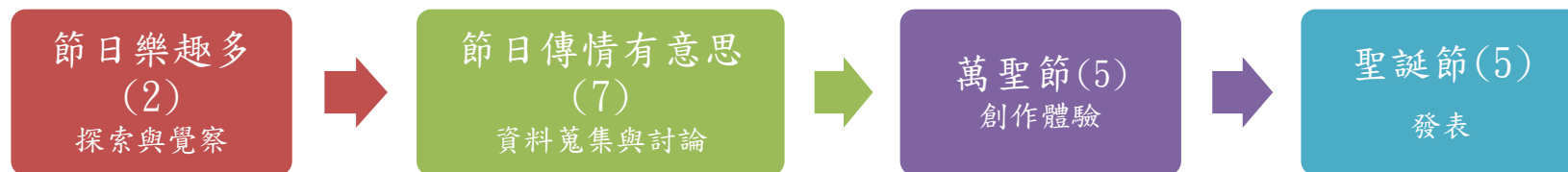
課程架構脈絡圖(單元脈絡自行增刪)