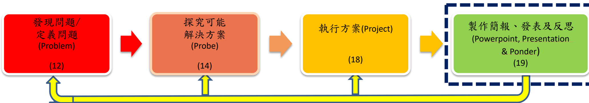
PBL 學習架構與模式脈絡圖(各單元問題脈絡)