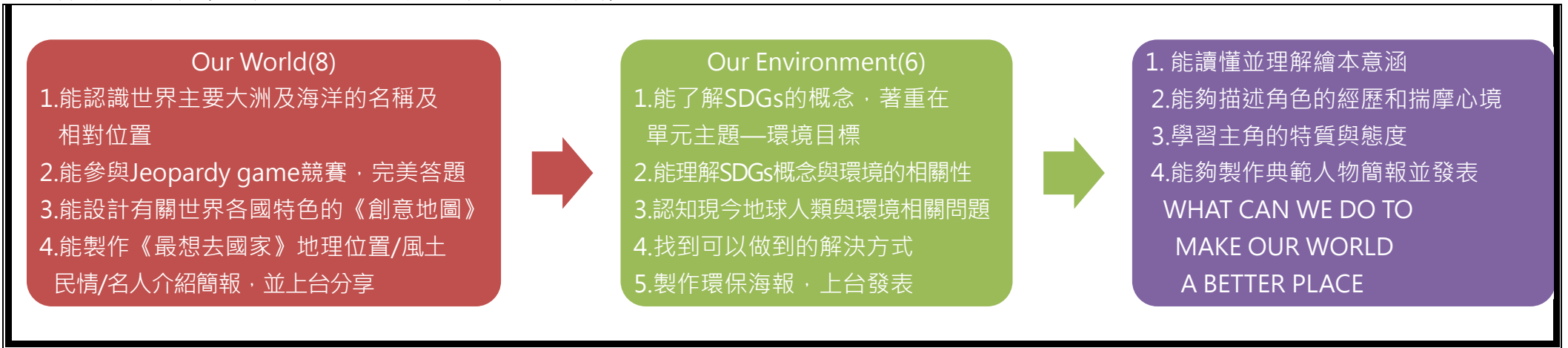
本表為第一單元教學流設計(本學期共三個單元)