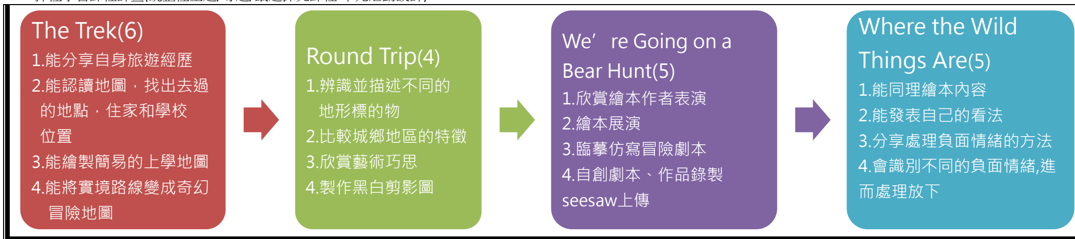
本表為第一單元教學流設計(本學期共四個單元)