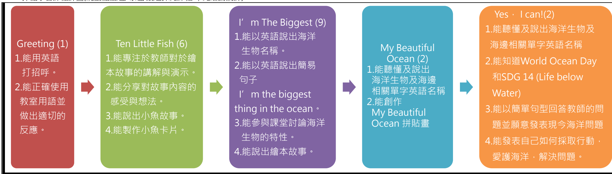
本表為第一單元教學流設計(本學期共五個單元)