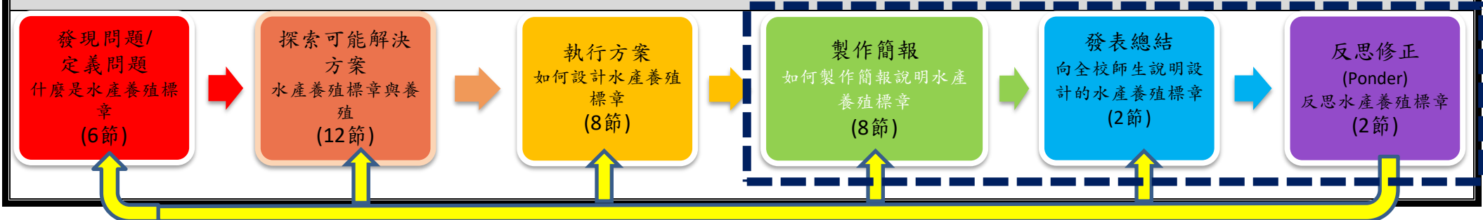
PBL 6P 學習架構與模式脈絡圖(各單元問題脈絡)