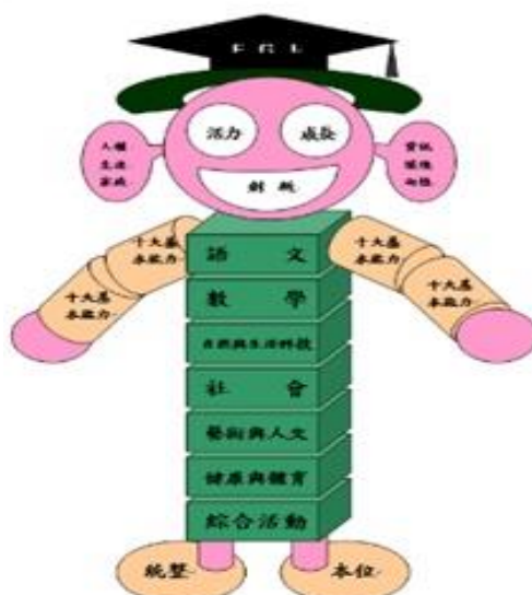
安定國小理想兒童圖像