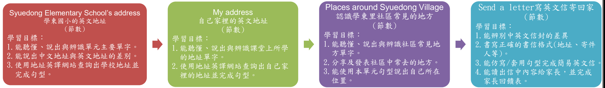
課程架構脈絡圖(單元請依據學生應習得的素養或學習目標進行區分)(單元脈絡自行增刪)