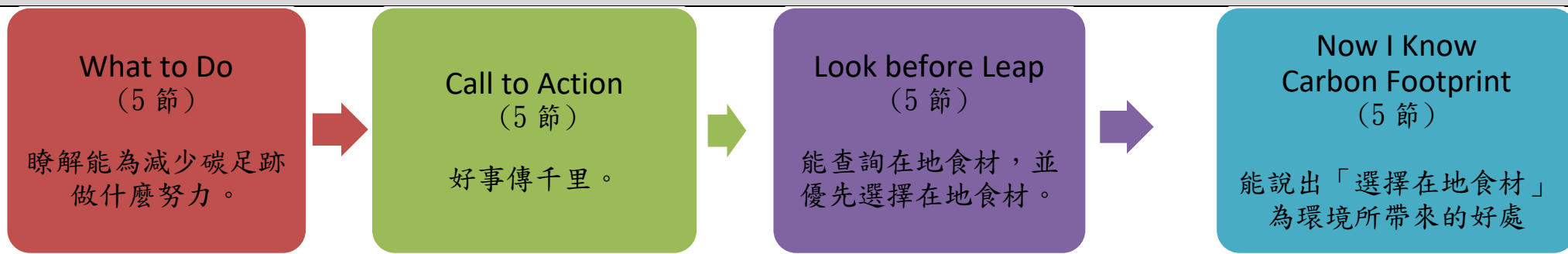
課程架構脈絡圖(單元請依據學生應習得的素養或學習目標進行區分)(單元脈絡自行增刪)