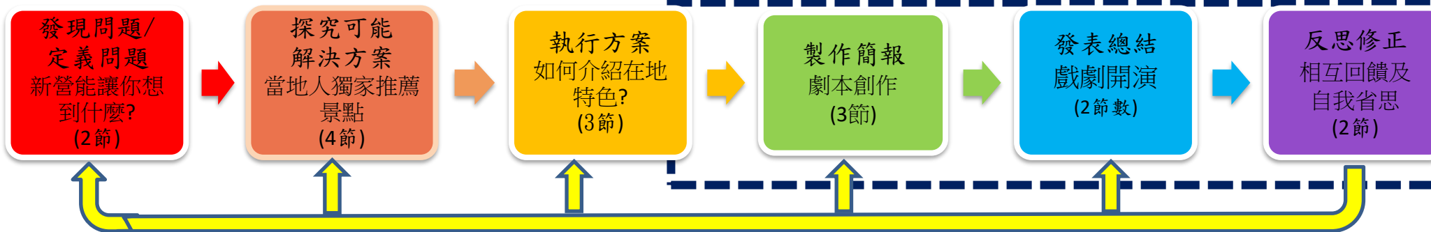
PBL 6P 學習架構與模式脈絡圖(各單元問題脈絡)