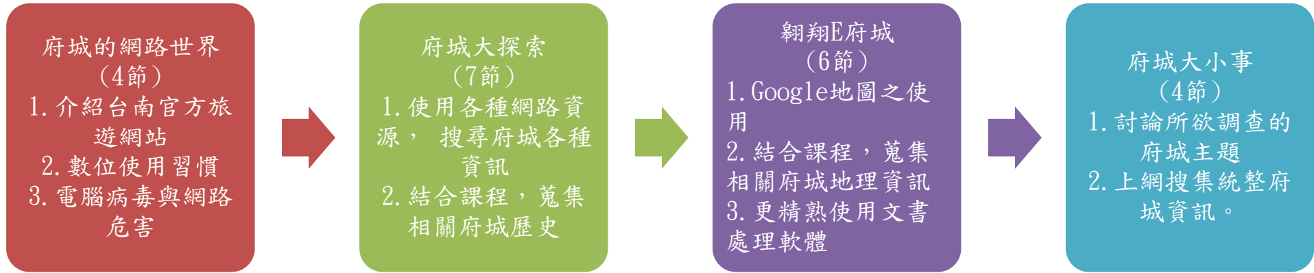
本表為第1單元教學流設計/(本學期共4個單元)