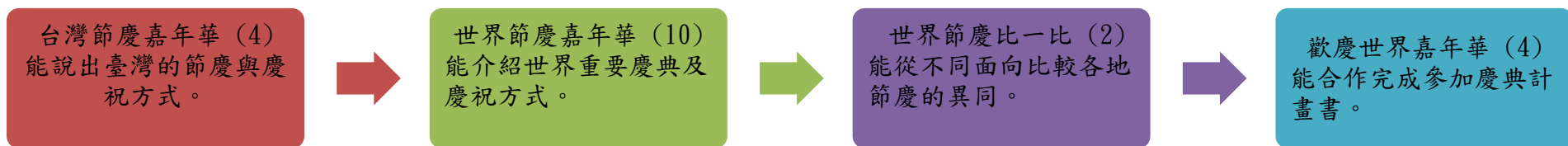
課程架構脈絡圖(單元請依據學生應習得的素養或學習目標進行區分)(單元脈絡自行增刪)