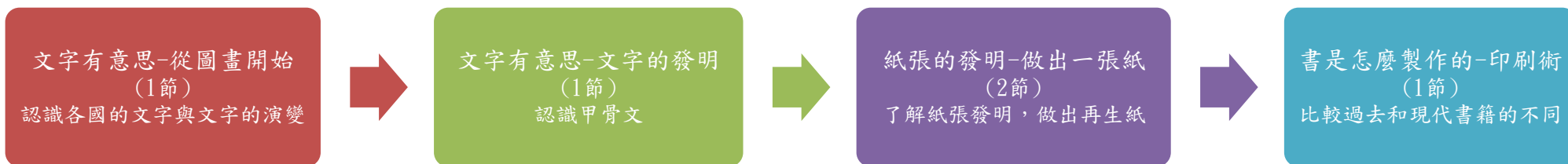
課程架構脈絡圖(單元請依據學生應習得的素養或學習目標進行區分)(單元脈絡自行增刪)