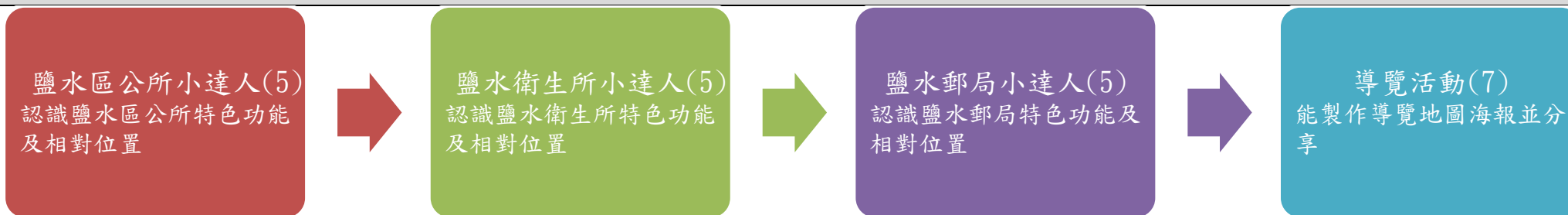
課程架構脈絡(單元請依據學生應習得的素養或學習目標進行區分)(單元脈絡自行增刪)