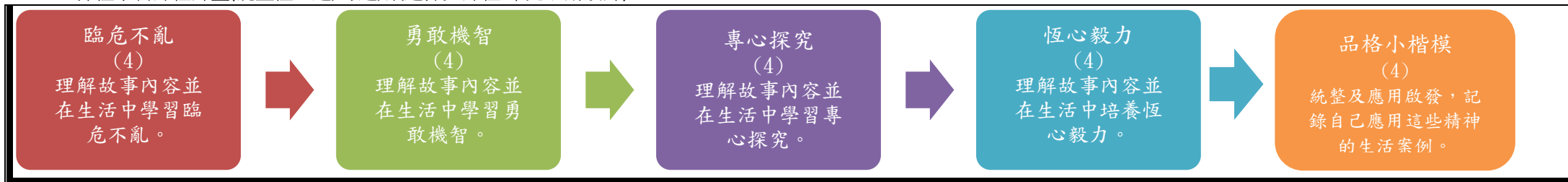
本表為第一單元教學流設計/(本學期(年)共五個單元)