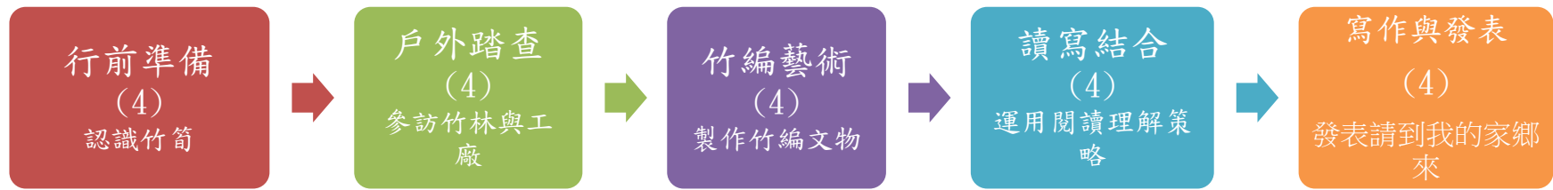
課程架構脈絡圖(單元請依據學生應習得的素養或學習目標進行區分)(單元脈絡自行增刪)