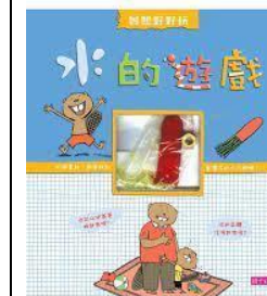
C6-1 彈性學習課程計畫(統整性主題/專題/議題探究課程-單元活動設計)