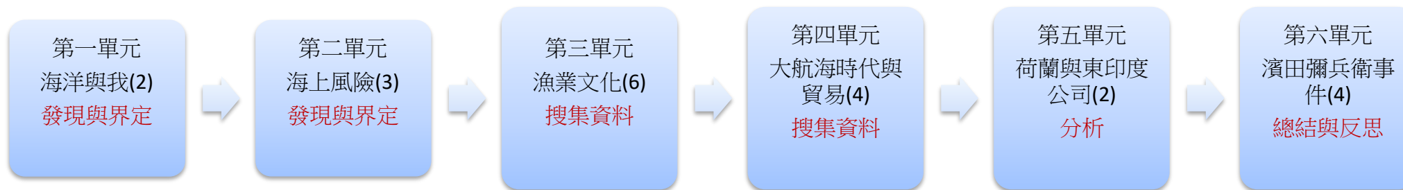
本表為第一單元教學流設計/(本學期(年)共六個單元)