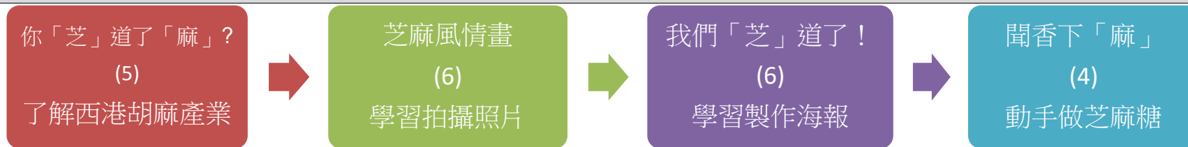
課程架構脈絡圖(單元請依據學生應習得的素養或學習目標進行區分)(單元脈絡自行增刪)